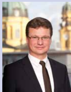
Bernd Sibler Staatssekretär im Bayerischen Staatsministerium für Unterricht und Kultus