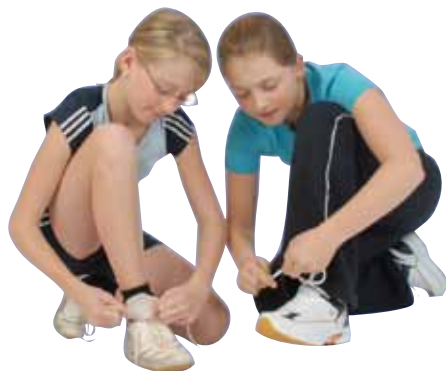
Ideal für den Sportunterricht: Universal-Hallen-Sportschuh (Schulsportschuh)

Sportschuhe, die man im Sportunterricht in der Halle trägt, sollen nicht auf der Straße getragen werden. Sie bringen sonst Schmutz in die Sporthalle, erhöhen dadurch das Unfallrisiko (Rutschgefahr) und die Gefahr der Verbreitung von Krankheitserregern. Wird der Hallensportschuh im Freien benützt, ist vor der weiteren Nutzung in der Sporthalle eine gründliche Reinigung des Schuhs erforderlich.