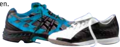
Joggingschuh / Universal-Hallen-Sportschuh

Man sollte sich beim Kauf also gut beraten lassen und die Möglichkeit nutzen, qualitativ hochwertige Auslaufmodelle preisgünstig zu erwerben.